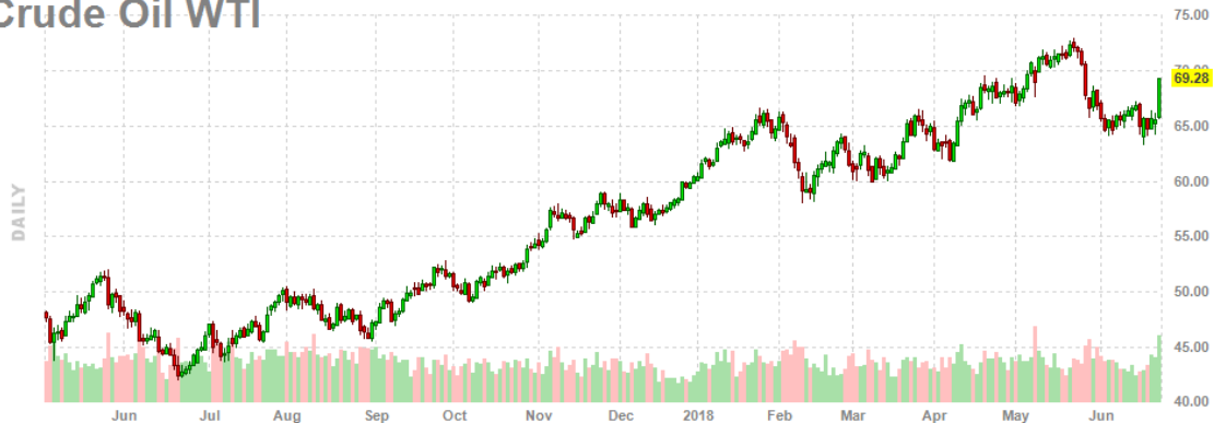
Crude Oil WTI

El Merval finalizó una semana muy relevante para la plaza local. Si bien el balance semanal resultó apenas positivo en pesos, alcanza el 4% si lo medimos en dólares. Además en la rueda del jueves se registró un volumen récord de $3.000 millones tras el anuncio de reclasificación de Argentina a Mercado Emergente.